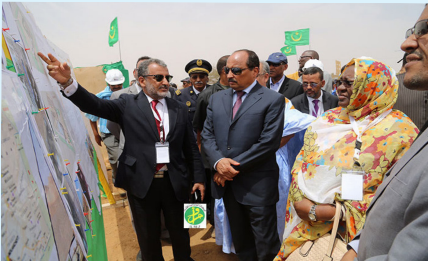
President Mohamed Abdel Aziz a Nema