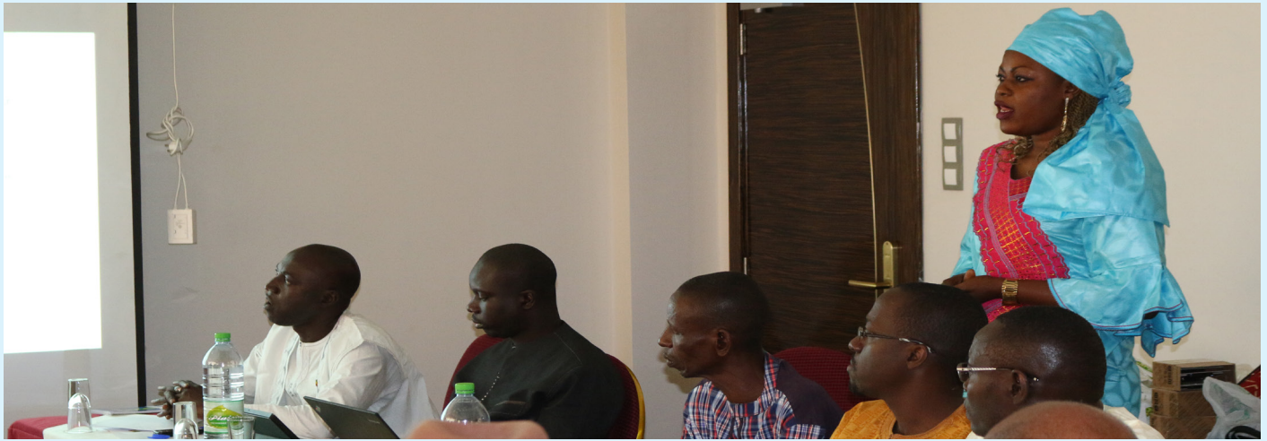
Reunion du comite regional d'orientation à l'hotel Fleur de Lys Dakar