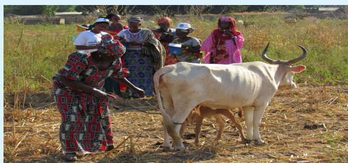
Formation sur la production laitière à Diambanota

Dans sa perspective de création de métiers verts, le PROGRES-Lait a lancé ses premières sessions de renforcements de capacités en production laitière dans les villages de Tatki (Podor) et de Diambanota (Kolda).