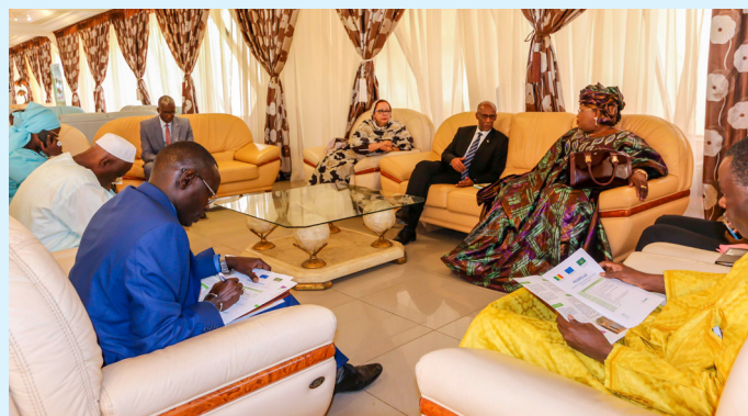
Echanges entre les officiels lors du lancement regional a Dakar

gner le Sénégal et la Mauritanie dans la réalisation d'action concrète et innovante ».