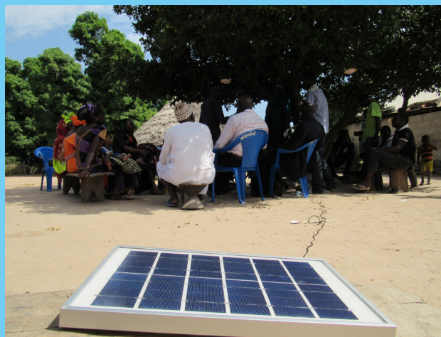
Echanges entre la population de Diambanota et l'équipe du PROGRES-Lait

Le Progrès-Lait est ainsi une réponse concrète à cette problématique de prise en compte des besoins énergétiques d'un secteur économique porteur qui peine à prendre son envol et freine l'essor de plusieurs communautés dont le lait constitue la principale source de revenus. Aussi notre accompagnement au projet revêt un caractère particulier pour les sites abritant les grandes plateformes qui pourront aussi bénéficier d'un mini réseau électrique pour l'alimentation des ménages.